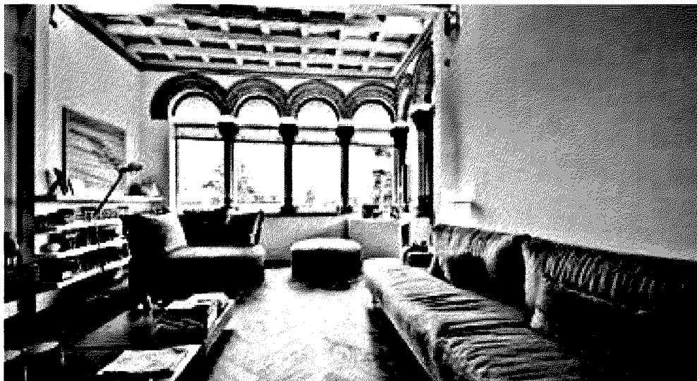
Appartamento in Viale Vittorio Emanuele II.