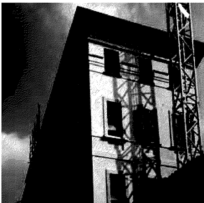
Il cantiere di Via Pradello.