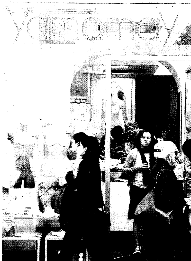
Il marchio Yamamav programma 40 aperture di negozi con 280 addetti

Libri punta a crescere del 10%, con 160 nuove agenzie per 320 posti di lavoro. Nei libri continuano le aperture per Mondadori e Feltrinelli. La prima ne prevede 26 con 78 nuove persone. Numeri simili anche per La Feltrinelli: 15 nuove librerie per 75 addetti. Nel settore poste Ki-Point (gruppo Sda), oltre ad aprire 15 nuovi punti vendita con una media di due persone ciascuno, entra nel progetto Grandi Stazioni, dove sono previste 13 aperture con altrettanti addetti. Anche per Smmartpost i nuovi punti vendita saranno una quindicina, con una media di 5-6 persone a negozio, in prevalenza postini e di figure commerciali.