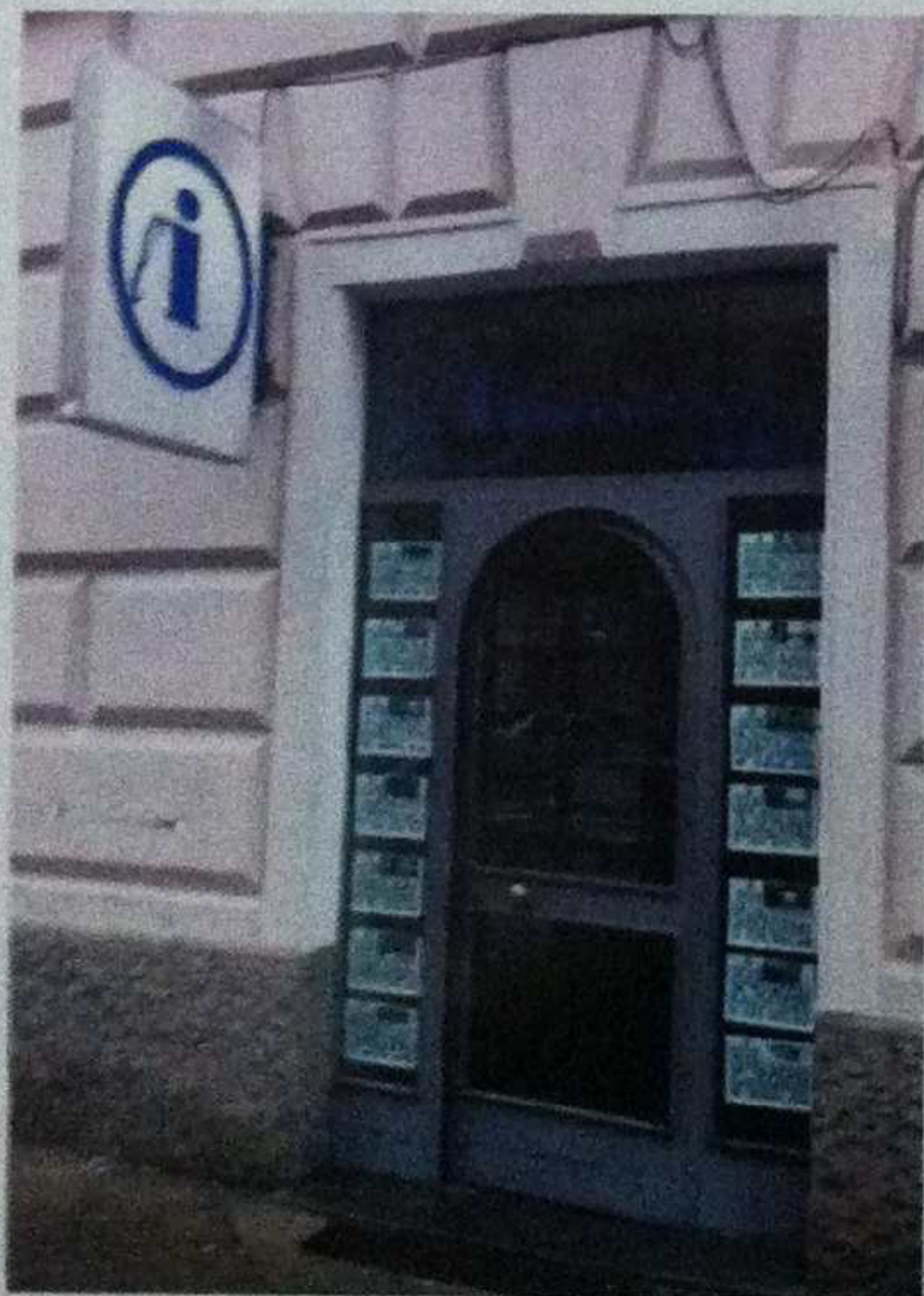
Una delle tante agenzie immobiliari del Gruppo Grimaldi "L'Immobiliare.com" che presto riceverà la connessione alla piattaforma MLS REplat