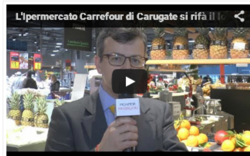
L'ipermercato Carrefour di Carugate si rifà il look Guarda gli altri video del nostro canale >>