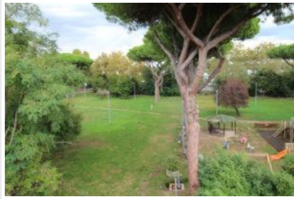
La vista sul Parco dei Ravennati da Villa Rosina

A volere questa carrabile fu nel 1931 l'architetto paesaggista Raffaele De Vico ( Parco di Colle Oppio, Piazza Mazzini e Viale Mazzini, restauro Teatro romano di Ostia Antica e di Villa Sciarra, ampliamento Giardino Zoologico e laghetto con giardini dell'Eur ) che ebbe il compito di progettare e mettere a dimora il Parco dei Ravennati prospiciente all'affaccio frontale di Villa Rosina.