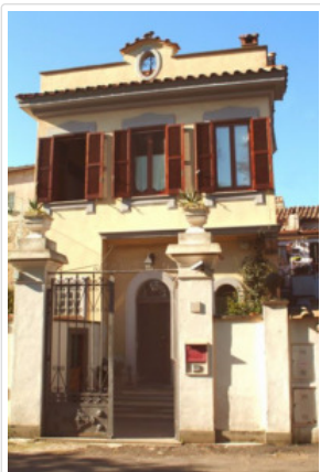
Villa Rosina (1930) in via Gesualdo 16

Si tratta di un edificio dal passato assolutamente originale . La sua costruzione è iniziata insieme con l' inaugurazione della via del Mare (1928) e conclusa nel 1930. A commissionarne l'edificazione fu un gerarca fascista che volle dedicarla alla sua amata, una bellissima ragazza dal nome di Rosina : il suo fascino resta impresso in un quadro che si trova nell'edificio e che qui pubblichiamo.